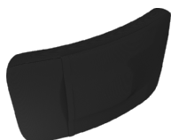
ULP535050320 Pad laterale per pelotte FSC Neoprene, mis. 3"x5"