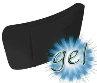
ULP557057120 Pad laterale per pelotte FSC GEL Neoprene, mis. 5"x7"