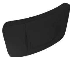
ULP546050320 Pad laterale per pelotte FSC Neoprene, mis. 4"x6"