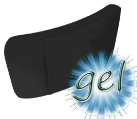
ULP546057120 Pad laterale per pelotte FSC GEL Neoprene, mis. 4"x6"