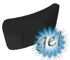
ULP535057120 Pad laterale per pelotte FSC GEL Neoprene, mis. 3"x5"