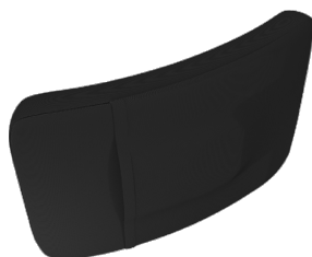
ULP557050320 Pad laterale per pelotte FSC Neoprene, mis. 5"x7"